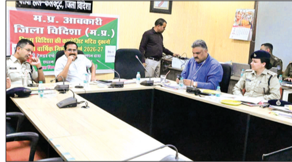
सुबह दस बजे से प्रारंभ होकर 5 मार्च को दोपहर 2 बजे तक ई-टेंडर एवं ई-टेंडर कम आक्शन के माध्यम से संचालित की जाएगी। बस स्टैंड

जिले में प्रथम चरण 1 में विदिशा जिले की 27 शराब दुकानों के 6 समूह की नीलामी प्रक्रिया ई-टेंडर और ई-टेंडर कम आक्शन के माध्यम से 27 फरवरी से शुरू होकर 2 मार्च की दोपहर 2 बजे तक ई-टेंडर और ई-टेंडर कम आक्शन के माध्यम से खोले गए हैं। द्वितीय चरण की प्रक्रिया के तहत 24 शराब दुकानों के 5 समूहों का ई-टेंडर एवं ई-टेंडर कम आक्शन के माध्यम से निष्पादन किया जाएगा। द्वितीय चरण की प्रक्रिया 3 मार्च को