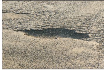
टोल टैक्स वसूली जारी है, लेकिन सड़क की मरम्मत और रखरखाव पर ध्यान नहीं दिया जा रहा। 40 किलोमीटर मार्ग पर कई जगह गड्डे 1 साल के अंदर फिर से हो गए हैं। जबकि एमपी आरडीसी द्वारा 1 साल पहले पुर रोड पर डामरीकरण किया गया था। गड्डों के कारण वाहन चालक परेशान हो रहे हैं। वाहन चालक इन गड्डों को बचाने के चक्कर में एक दूसरे से भिड़ जाते हैं जिससे दुर्घटनाओं में दिना दिन बढ़ती रही है। दूसरा कारण यह भी है कि रोड की चौड़ाई कम होने के कारण इस रोड पर आए दिन दुर्घटना होती रहती है 1 साल के अंदर ही भोपाल विदिशा हाईवे 18 पर 200 से ज्यादा

भोपाल-विदिशा स्टेट हाईवे 18 पर पिछले वर्ष एमपी आरडीसी द्वारा कराए गए डामरीकरण की गुणवत्ता पर गंभीर सवाल खड़े हो गए हैं। अभी एक साल भी पूरा नहीं हुआ कि सड़क पर जगह-जगह गड्डे हो गए हैं। स्थानीय लोगों का कहना है कि रोजाना करीब 12 हजार से अधिक छोटे-बड़े वाहन इस मार्ग से गुजरते हैं, जिनमें भारी वाणिज्यिक वाहन भी शामिल हैं। एमपीआरडीसी द्वारा